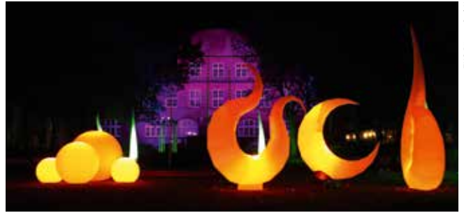
TMS Büsum GmbH

Vom 24. Oktober bis 1. November 2015 verwandeln Leuchtskulpturen die Freitreppe am Museumshafen und den neuen Rathauspark jeweils von 16-23 Uhr in eine ungewöhnliche Kulisse. Weitere Illuminationen werden am Leuchtturm, am Vitamaris und an der St. Clemens Kirche zu bewundern sein. Das Wechselspiel erfreut nicht nur die Fotografen, auch Gäste und Einheimische staunen beim Herbstwetter über die schönen Effekte.