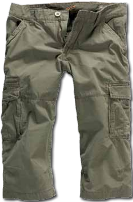
3/4-Cargo-Bermuda aus angenehmer Baumwoll-Popeline-Qualität Gesehen im camel active Store, Im Bad 40a, 25826 St. Peter-Ording, T 04863-4746 238