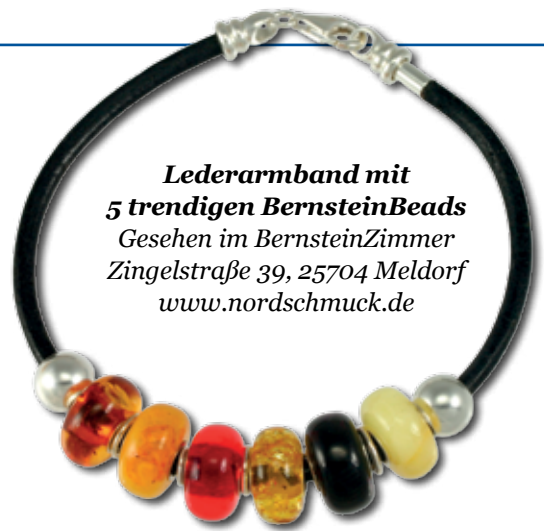
Lederarmband mit 5 trendigen BernsteinBeads Gesehen im BernsteinZimmer Zingelstraße 39, 25704 Meldorf www.nordschmuck.de