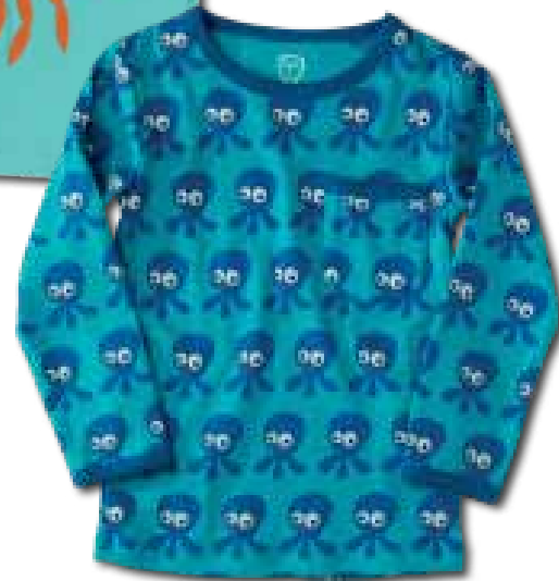
Ubang Jolly Crab Krebs Shirt Interaktivshirt - Spielshirt „Hebe den Arm und der Krebs schnappt zu ej sikke lej Retrosshirt Gesehen bei Kleine Lachmöwe Bundesstr. 22, 25693 Trennewurth T 04857 - 90 16 03