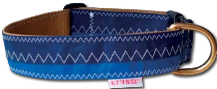
Unique Hundehalsbänder aus gebrauchtem Obermaterial wie Surfsegel, Kite etc. Gesehen in der Giftbude St. Peter Ording www.uniquehalsbaender.com